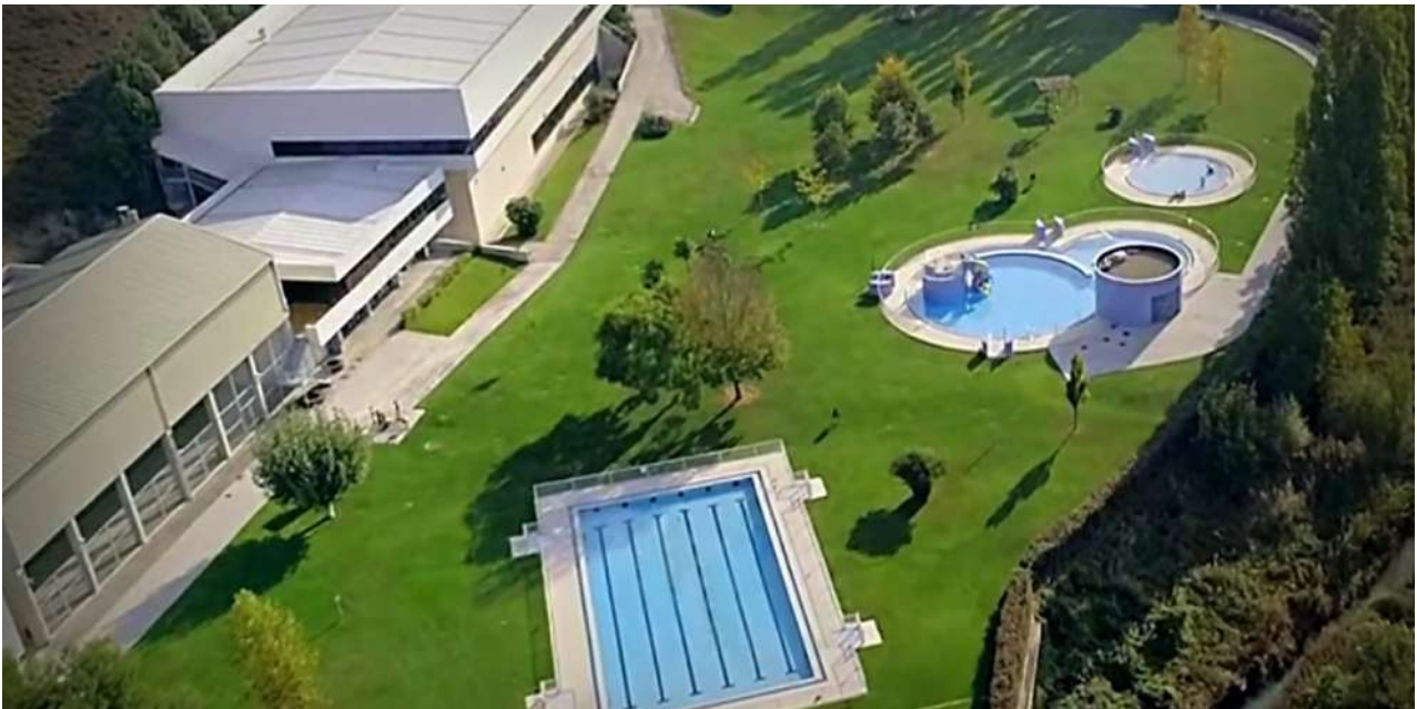
Vista Aérea SDC Echavacoiz

Este año la Junta Directiva va a premiar a nuestros soci@s que lleven más de 10 años con nosotros. Para ello se podrán beneficiar de dos invitaciones a 6€ cada una. Estas serán compradas en taquilla. Solo se podrá utilizar una vez al verano por la misma persona. Para ello deberá entrar y enseñar el DNI y estar acompañado con el soci@ que haya retirado la invitación. Las invitaciones no podrán ser facilitadas a otra persona ya que serán nominativas. Las invitaciones serán válidas en Julio y Agosto.