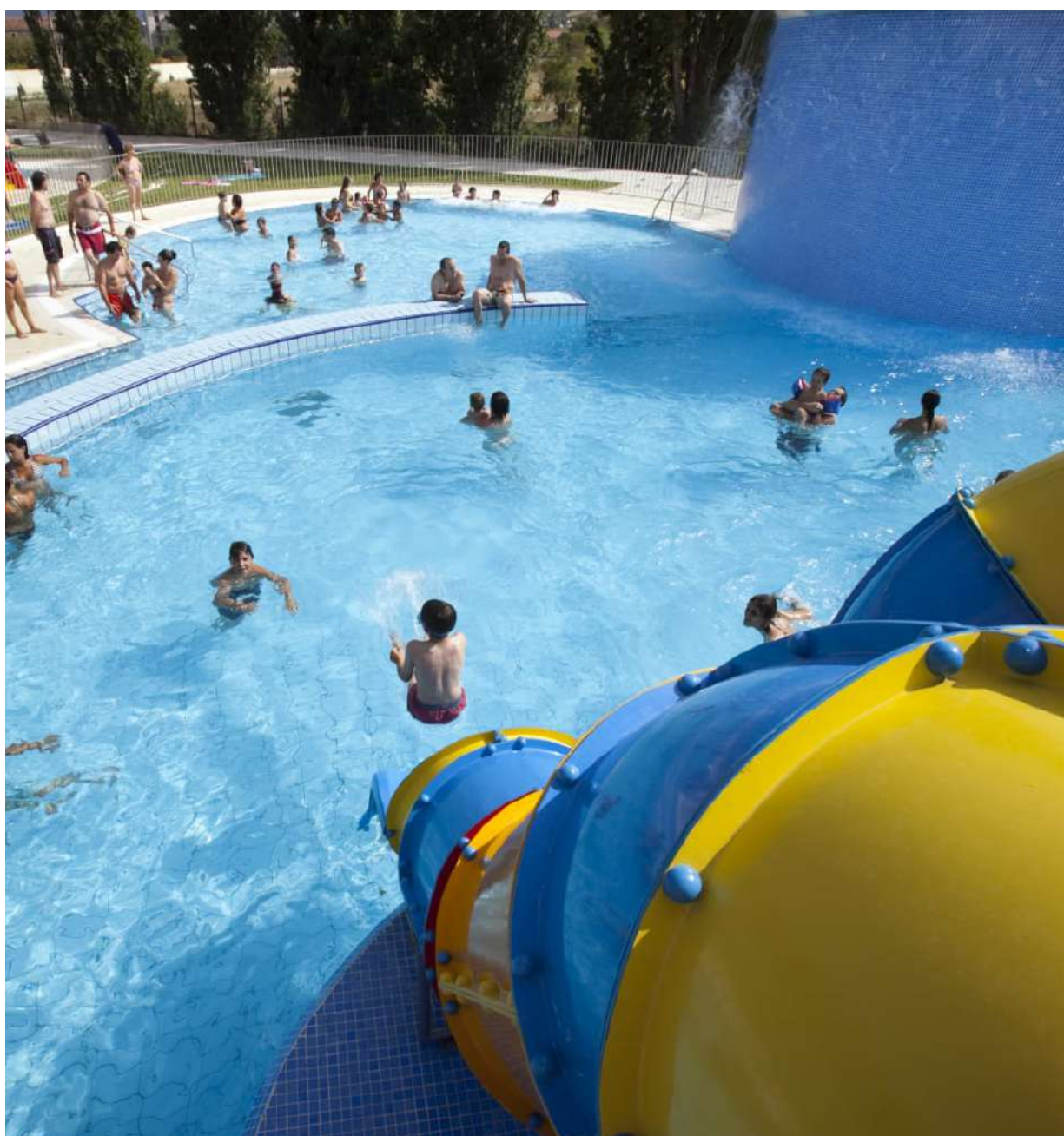
Piscina de toboganes